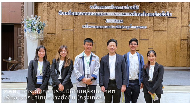
กสศ. เวทีระดมพลังความร่วมมือขับเคลื่อนอนาคตเพื่อการศึกษาไทยอย่างยั่งยืน (กรุงเทพ)