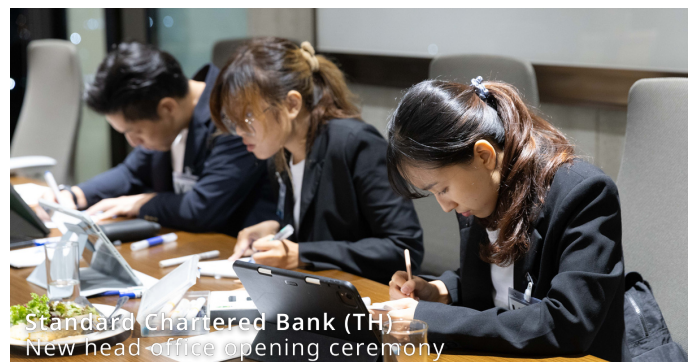
Standard Chartered Bank (TH) New head office opening ceremony