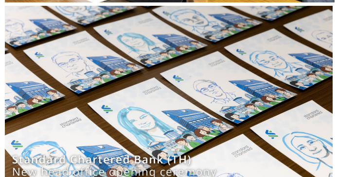
Standard Chartered Bank (TH) New head office opening ceremony