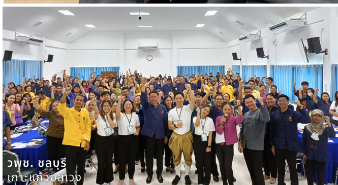
วพช. ชลบุรี เกาะแก้วอลเวง